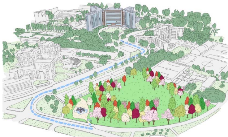
Le illustrazioni riportate sono indicative